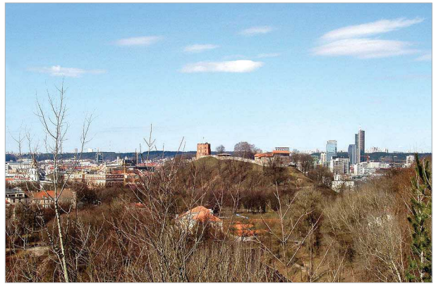
7 pav. Charakteringa Vilniaus miesto centro panorama nuo neįrengtos, pagal miesto Bendrąjį planą numatytos, apžvalgos vietos Užupyje

Fig. 6. Buildings on Žygimantu street at the Green bridge; the problematic site of Vilnius Old Town (the left bank of the River Neris)