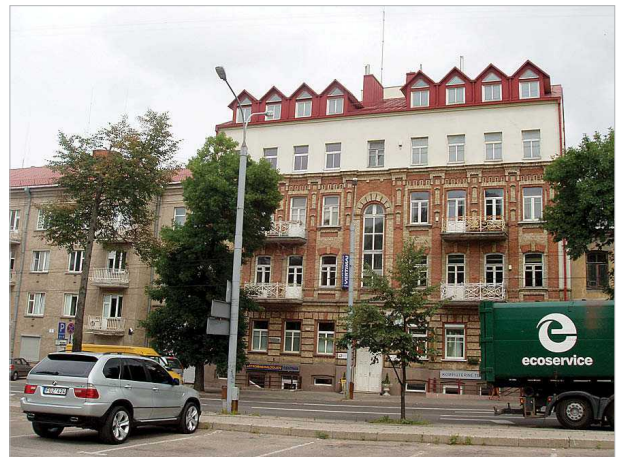
2, 3 pav. Pamėnkalnio gatvės pastatų aukštinimo svarstyti pavyzdžiai

Figs 2–3. Discussable examples of elevation buildings on Pamėnkalnio street