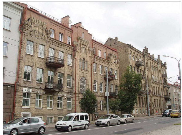
Fig. 1. Vilnius city center “Architectural Hill”, Konstitucijos avenue (the right bank of the River Neris)