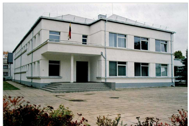
7 pav. Alytaus senamiesčio pradinė mokykla dabar (po rekonstrukcijos)

Fig. 7. Elementary School of Alytus old town (after reconstruction)