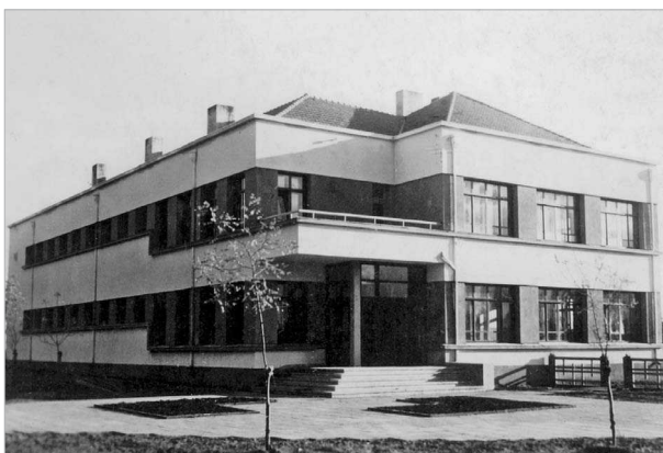
6 pav. Alytaus pradinė mokykla Nr. 4 Birutės g. 26, pastatyta 1937 m., archit. Vytautas Trečiokas (1939 m. nuotrauka)

Fig. 5. Private dwelling house in new town, Maironis str., built before the War