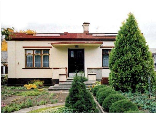
5 pav. Privatus gyvenamasis namas Naujamiestyje, Maironio g., statytas prieškarui

Tačiau V. Trečioko reikšmingiausias kūrinys – moderni Alytaus pradinė mokykla Nr. 4, esanti Birutės g. 26, pastatyta 1937 m. (vėliau berniukų gimnazija) (6 pav.). Mokyklos fasadai buvo apdailinti gelsvo atspalvio tinku, tarpulaniai – tamsiai rudos spalvos, stogas – raudoną čerpių (dabar dengtas šiferiu). Eksterjere neįprastai atrodė pagrindinio įėjimo tam-