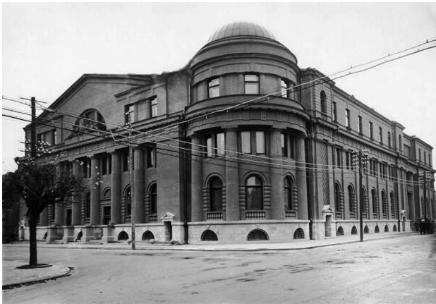
1 pav. Lietuvos valstybinio banko rūmai Kaune (tarptautinis konkursas – 1924 m., įgyvendintas – 1928 m., archit. M. Songaila)