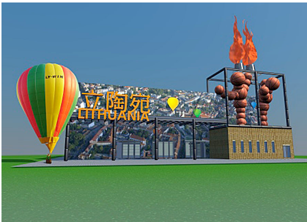
3 pav. Lietuvos paviljonas pasaulinėje parodoje Expo 2010 . Konkursą laimėjęs bendrovės Expobalta projektas „F-LY Lithuania“

„F-LY Lietuva“ (3 pav.). Stendų statytojų asociacijai atstovaujančios įmonės projektas išrinktas Aplinkos ministerijos klerkų suorganizuotame konkurse tik iš 5 darbų. Apie skubotai 2009 m. lapkričio 20 d. (darbus pristatyti reikėjo iki gruodžio 7 d.) paskelbtą konkursą Lietuvos architektų sąjunga papildomai nebuvo informuota, o konkurso sąlygos buvo orientuotos ne į architektus, bet į ekspozicijų įrengimo patirtį turinčias įmones (LAS 2010). Pasaulinėje parodoje, kurios pagrindinė tema – „Geresnis miestas, geresnis gyvenimas“, ir bus pristatomi pažangiausi šiuolaikinių miestų planavimo ir projektavimo pavyzdžiai, Lietuva ketina reprezentuoti prekybinį kioską primenančiu neaiškios estetinės išraiškos kratiniu, kurio įtartina bankrutavusią oro bendrovę primenantį pavadinimą pateisina tuštybę ir techninį atsilikimą vizualizuojanti oro baliono tematika.