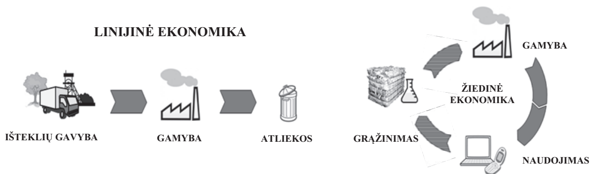
1 paveikslas. Linijinės ir žiedinės ekonomikos modelių palyginimas Figure 1. Comparison of linear and circular economy models

Pakartotinas naudojimas (angl. reuse ) – tai procesas, kuriuo metu produktai arba jų komponentai, kurie nėra priskiriami atliekoms, naudojami tam pačiam tikslui, kuriam buvo sukurti. Pakartotinas perdirbimas yra labai patrauklus aplinkosaugos požiūriu, nes naudojama mažiau išteklių, energijos ir mažiau darbo, palyginti su naujų produktų gamyba iš pirminių medžiagų. Perdirbimas (angl. recycle ) – tai procesas, kuriuo metu atliekos perdirbamos į produktus, kurie gali būti panaudojami pirminiais arba kitais tikslais. Atliekų perdirbimas suteikia galimybę su-